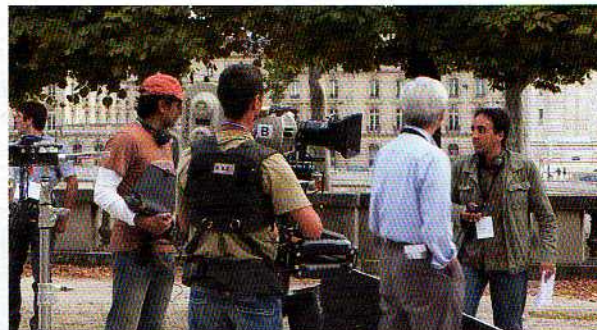
Ali Cherkaoui (à droite) avec Night Shyamalan ( Sixième sens, Incassable... ) sur le tournage de son dernier film à Paris ( The Happening ).

préparation du film et du tournage, il a consacré des centaines d'heures de travail pour mettre au point un outil destiné à gérer le planning, les costumes, les accessoires, la paye et les contrats, à générer un code-barres et à imprimer une carte plastifiée pour chaque figurant (ci-dessous). Ce système a été amélioré sur des grands tournages comme Kundun , Gladiator ou La momie . Sa prochaine étape, rendre ces infos accessibles sur un iPhone. "Je suis sûr qu'il y a des milliers de choses à faire avec le téléphone d'Apple." www.alitronics.com